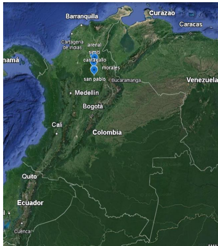
Ilustración 1. Localización de municipios en Colombia. Fuente: Google Maps

Territorialmente ocupa hacia el occidente un alto porcentaje de la Serranía de San Lucas, sistema orográfico del Sur de Bolívar. Su posición geográfica es la 7° 09' 00" de Latitud Norte y 75° 56' 00" de longitud. San Pablo, limita al norte con el municipio de Santa Rosa del Sur y Simití departamento de Bolívar, al sur con el municipio de Cantagallo, al oeste con Remedios y Segovia (municipios del departamento de Antioquia) y al este con el municipio de Puerto Wilches (departamento de Santander).